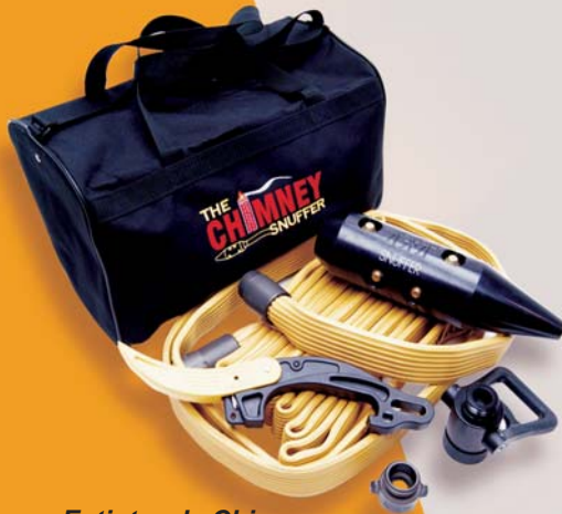
Extintor de Chimenea