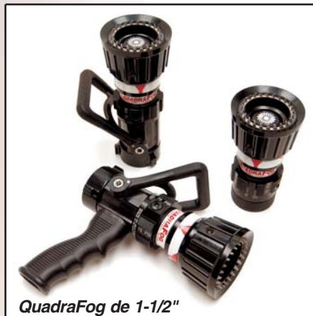
QuadraFog de 1-1/2"