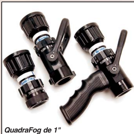
QuadraFog de 1"

Para más informaciones llamar intsales@tft.com visitar a www.tft.com o contactar el distribuidor TFT autorizado local.